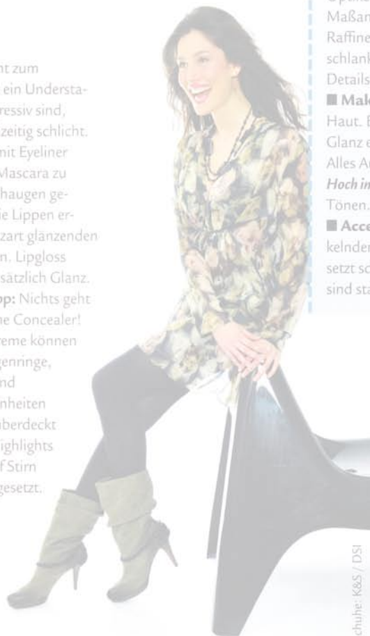
Schuhe: K&S / DSI