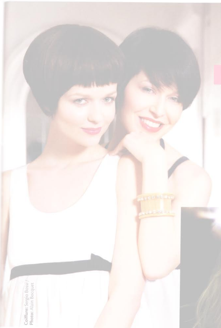
Coiffure: Sergio Bossi